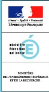
Schéma d'emplois 2011 - 2013