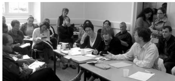
Conseil syndical Non-Titulaires Rennes le 20 septembre 2011

En organisant des réunions départementales et un conseil syndical ayant réuni plus de 70 collègues le 20 septembre à Rennes, le SNES, le SNEP et le SNUEP mettent leurs paroles en acte : véritable force de proposition, soutien aux collègues, information sur les droits des non-titulaires, suivi des affectations... le SNES et ses militants, titulaires et non-titulaires, et ses représentants à la CCP sont toujours dans la lutte !