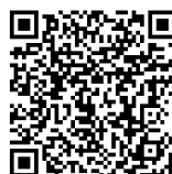
GUIDE DU RENDEZ-VOUS DE CARRIERE DES PERSONNELS ENSEIGNANTS, D'ÉDUCATION ET PSYCHOLOGUES DE L'ÉDUCATION NATIONALE

Les modèles de grilles d'évaluation utilisés peuvent également être consultés sur notre site : www.snes.edu/les-criteres-d-