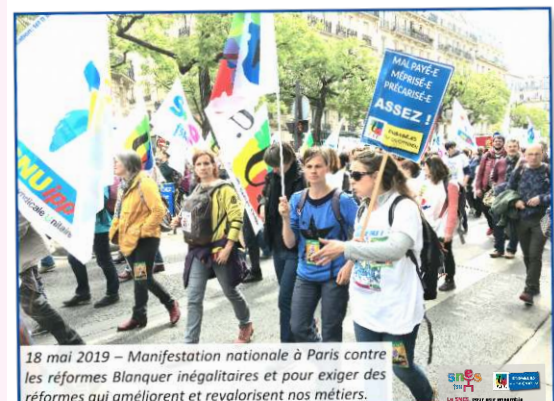
18 mai 2019 – Manifestation nationale à Paris contre les réformes Blanquer inégalitaires et pour exiger des réformes qui améliorent et revalorisent nos métiers.