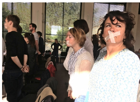
Action symbolique des élu-es des personnels au rectorat de Rennes en juin 2019 pour dénoncer le risque majeur de la fin du paritarisme.