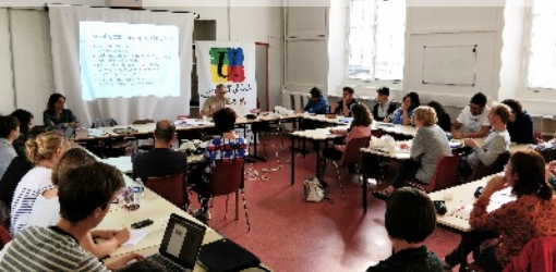
Réunion d'information TZR du SNES Bretagne en août 2018