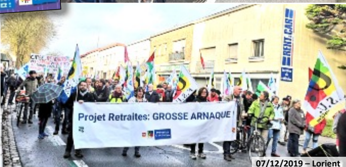
07/12/2019 – Lorient