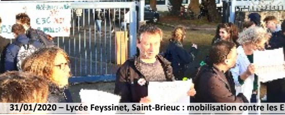
31/01/2020 – Lycée Feyssinet, Saint-Brieuc : mobilisation contre les E3C