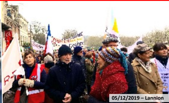
05/12/2019 – Lannion