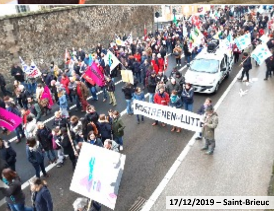
17/12/2019 – Saint-Brieuc