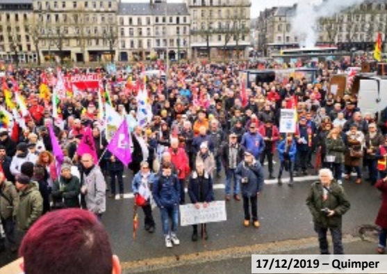
17/12/2019 – Quimper