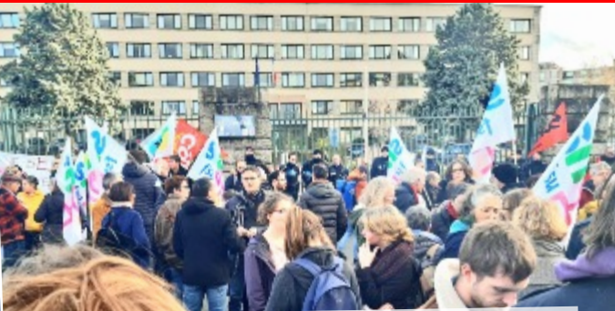
15/01/2020 – Rennes : Rassemblement intersyndical et lâché de cartables symbolique au rectorat pour dénoncer les E3C et leurs conditions d'organisation