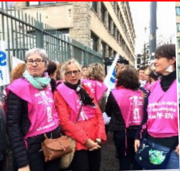
15/10/2019 – Rennes : mobilisation des PsyEN, personnels administratifs et enseignant-es pour défendre le service public d'orientation de l'Education nat.