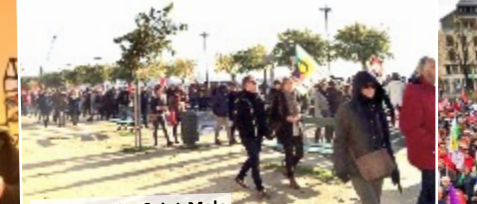
05/12/2019 – Saint-Malo