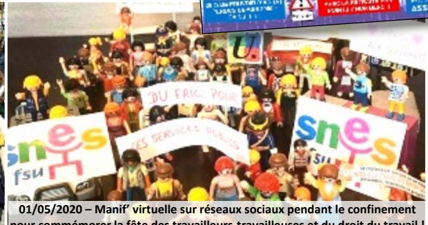
01/05/2020 – Manif' virtuelle sur réseaux sociaux pendant le confinement pour commémorer la fête des travailleurs-travailleuses et du droit du travail !