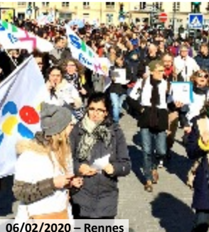
06/02/2020 – Rennes