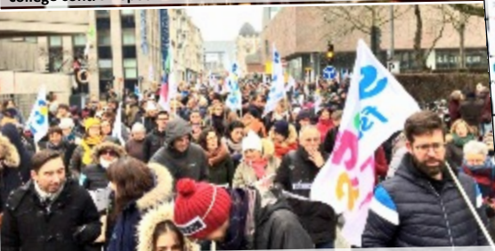
24/01/2020 – Rennes : encore beaucoup de monde pour dire NON à la réforme des retraites par points, retraite en moins...