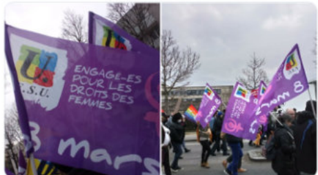
3:28 PM - 8 mars 2022 -

Plus de 1000 manifestant.es à #Rennes pour les droits des femmes ce midi. Pour l'égalité salariale on ne lâche rien ! #FSU #FSU35 Les syndicats et associations tiennent cet après midi des stands place de la République