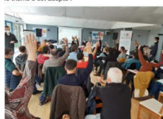
3:51 PM - 7 avr. 2022 - Talltus for Android

Congrès académique du SNES Bretagne de Locronan : le thème 3 est adopté !