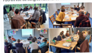
7:22 PM - 6 avr. 2022 - Talltus for Android

Congrès #SNES2022 Bretagne à Locronan : le travail en commission a nourri de nombreuses réflexions et des débats riches sur les textes d'orientation du SNES-FSU en vue du congrès national de mai.