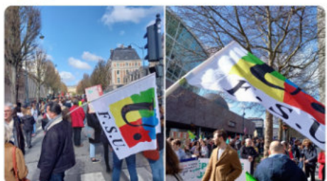
12:53 PM - 12 mars 2022 -

A Rennes, comme partout en France ce 12 mars, journée de mobilisation avec deux temps forts pour le #climat #DontLookUp et pour la paix en #Ukraine avec la @fsu_35