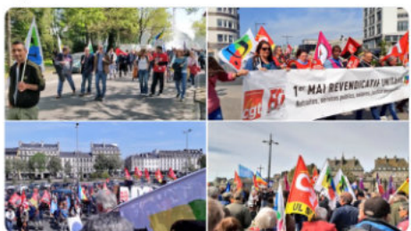
1:00 PM - 1 mai 2022 -

Belles manifestations #1erMai sous le soleil en Bretagne à #Rennes (+2000 personnes, haut g.), à #SaintBrieuc (+1000 personnes, haut d.), à Quimper (bas g.), Brest, Saint-Malo (bas d.)... Pour défendre l'emploi, les salaires, les pensions, les services publics, la justice sociale!