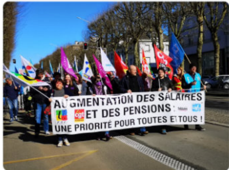
10:57 AM - 17 mars 2022 - 1

Pour nos #Salaires, pour nos #pensions... Lorient se mobilise !! #revalorisation #greve17mars