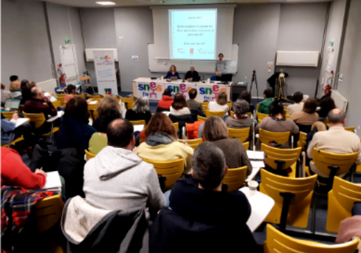
Rennes, le 2 mars : stage « reprenre la main sur l'évaluation »