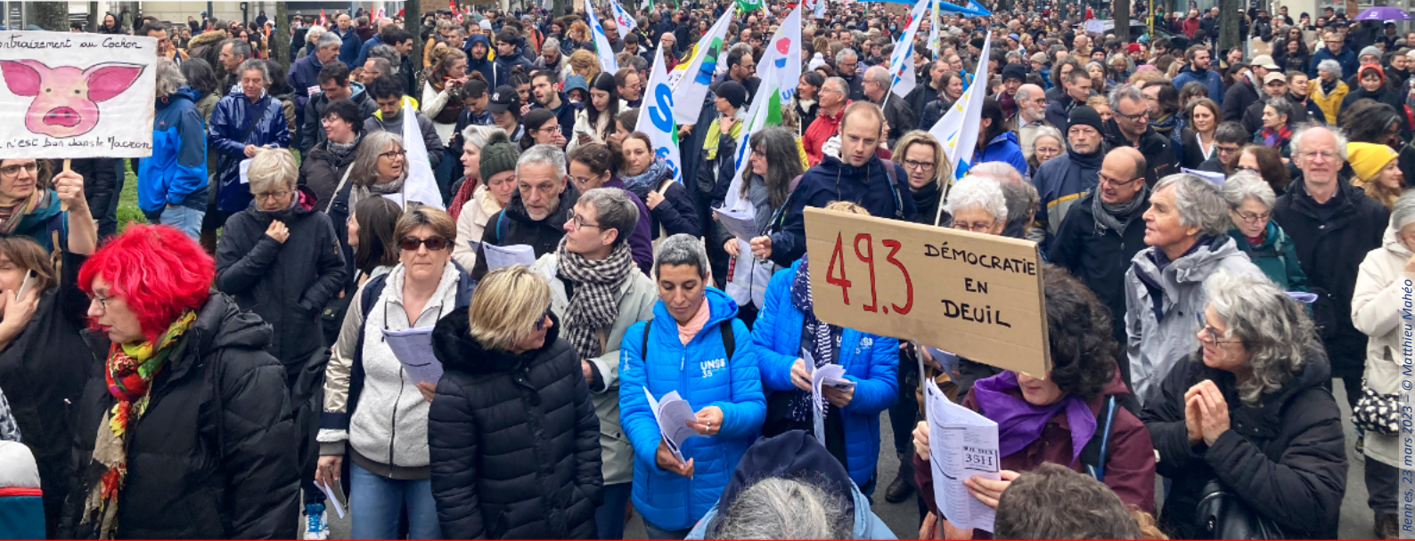
Rennes, 23 mars 2023