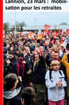
Lannion, 23 mars : mobilisation pour les retraités