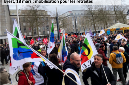
Brest, 18 mars : mobilisation pour les retraités