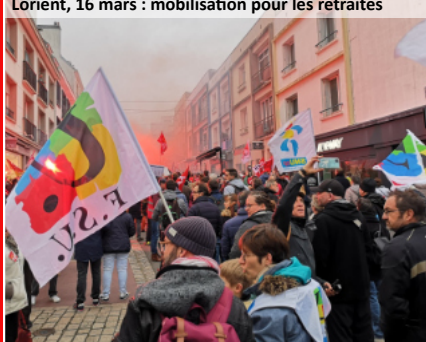
Lorient, 16 mars : mobilisation pour les retraités