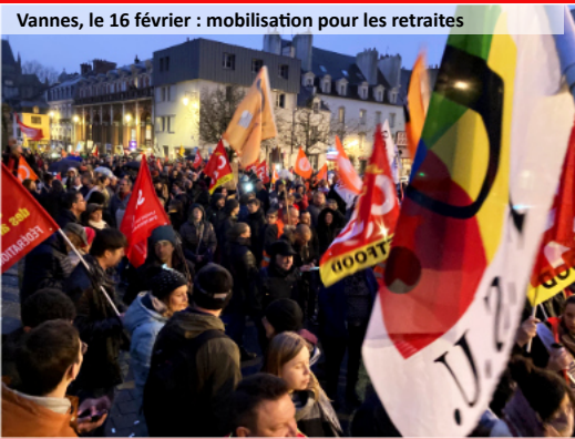
Vannes, le 16 février : mobilisation pour les retraités

Le programme et les modalités d'inscription sur le site FSU Bretagne : r.snes.edu/StageFSU