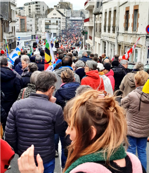
Saint-Brieuc, le 16 mars : mobilisation pour les retraités