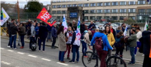
Rennes, 18 mars : mobilisation devant le rectorat pour dénoncer la suppression de la technologie en Sixième