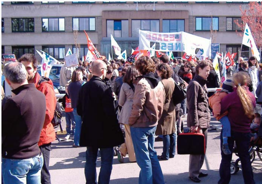
Rassemblement du 7 avril devant le Rectorat - Rennes